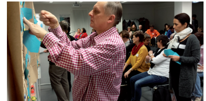
Auch das Feedback will gelernt sein - Fischernetz beim Kursleitertag 2016

Am 20.10. laden BVV und vhs Potsdam zum fachübergreifenden Kursleitertag im Bildungsforum ein. Ein Impulsvortrag zur Rolle von Kursleiter*innen in der Erwachsenenbildung verspricht interessante Denkanstöße. Beim Kneipenquiz zeigen Politiker*innen und Weiterbilder*innen, was sie voneinander wissen. Zahlreiche Workshops zu Arbeitstechniken, neuen Materialien und Entspannung bieten Gelegenheit für den Austausch.